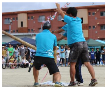
必殺仕事人も登場！

子ども達の演技や競技に、健気な姿に、心からのご声援や温かい拍手によって運動会を盛り上げてくれた保護者並びに地域の皆さんに心から感謝を申し上げます。