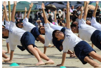
美しく揃っていた個人技